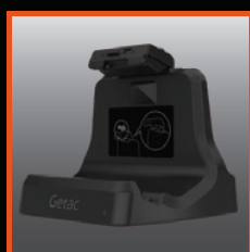
Station d'accueil pour bureau