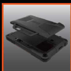
Module SnapBack pour bureau