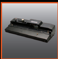
Station d'accueil pour bureau